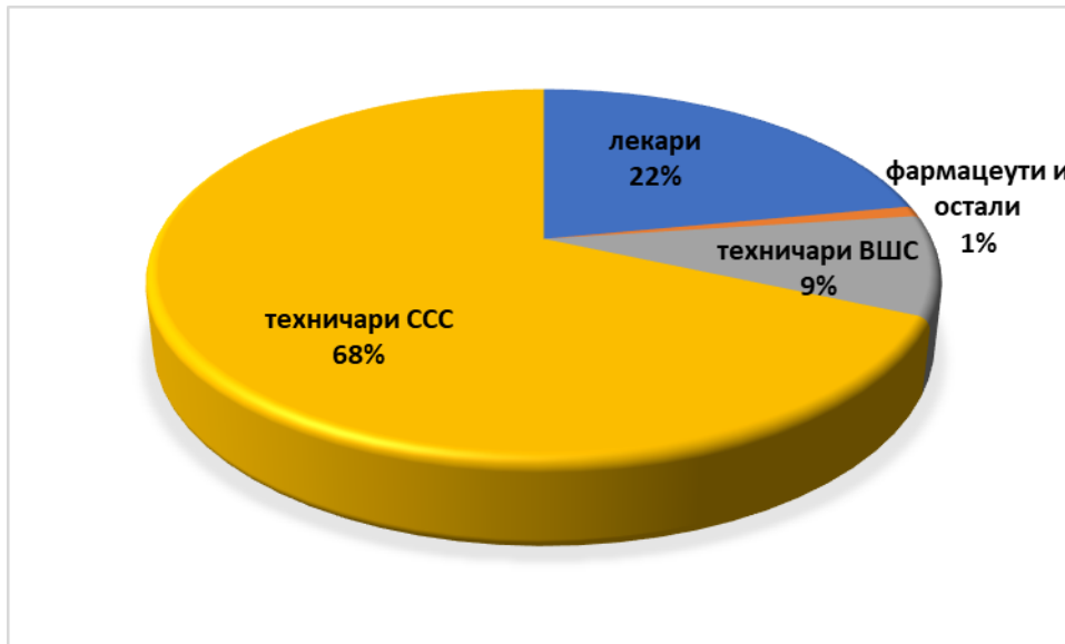
Графикон 1. Приказ здравствених радника и здравствених сарадника ОБ Зајечар 2022.године у односу на ниво стручне спреме